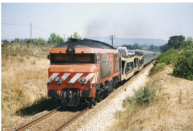
Figura 3. A locomotiva 1938 da CP em Vale Longo, Linha do Sul, rebocando o Comboio Azul no sentido Faro - Porto-Campanhã, em julho de 1999. O serviço “Auto-Expresso” complementou este comboio entre 1996 e 2006.

Gare do Oriente, Ponte 25 de Abril e Setúbal, e também pela Linha do Sul, fruto da modernização desta via ferroviária em 2004.