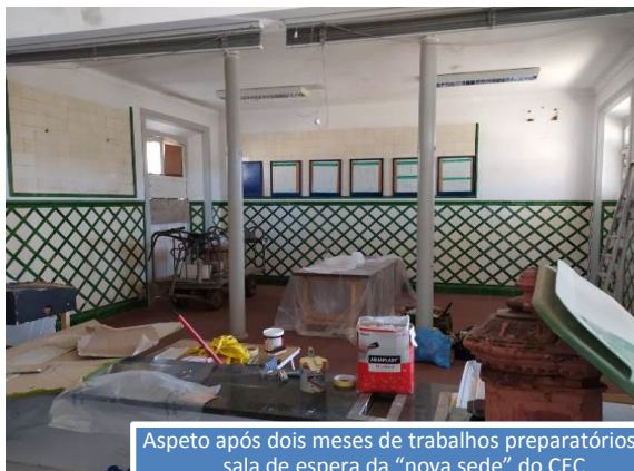
Aspetto após dois meses de trabalhos preparatórios da sala de espera da "nova sede" do CEC

cotas de 2020 e atrasadas tendo em conta que o CEC vive quase exclusivamente desta fonte de financiamento. Portanto, a sede vai manter-se oficialmente encerrada aos Sábados até Setembro devido à situação pandémica. Todavia, os sócios que tenham interesse em visitar as futuras instalações do CEC, sendo necessário trazer uma máscara, durante a semana podem combinar com: