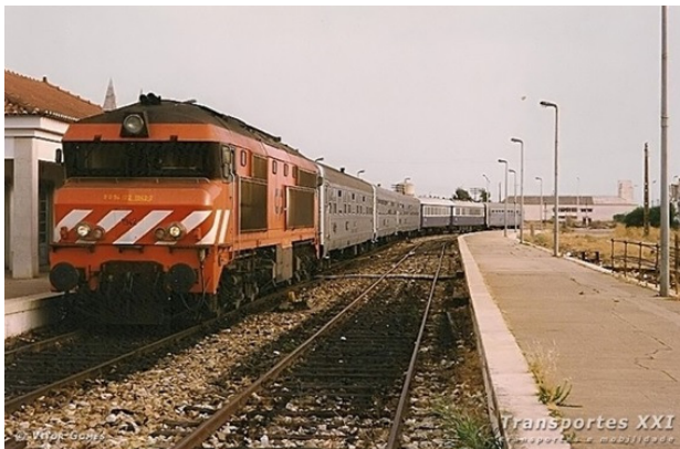
Figura 1. O Comboio Azul à chegada à antiga estação de Vila Real de Santo António-Guadiana, procedente de Porto-Campanhã, em julho de 1996. Esta estação encerrou em 1998.

O Comboio Azul era o nome atribuído a um serviço ferroviário explorado pela CP – Comboios de Portugal, que circulava às sextas-feiras no sentido Faro – Porto, e aos domingos no sentido Porto – Faro.