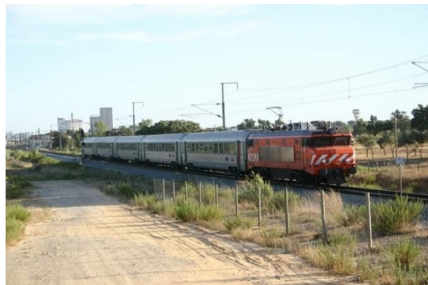
Figura 5. O Comboio Azul à passagem por Ermidas-Sado a caminho de Porto-Campanhã, em agosto de 2006, já na sua versão Intercidades.

O Comboio Azul foi suprimido no dia 21 de abril de 2007, na sequência da entrada em vigor de quatro ligações diárias em Alfa Pendular entre o Porto e Faro. Atualmente, as viagens entre estas duas cidades chegam a demorar perto de cinco horas e 50 minutos, com a tripulação a render na estação de Lisboa-Oriente em ambos os sentidos.