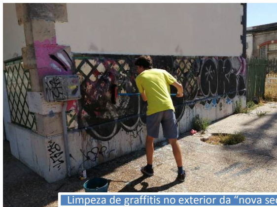
Limpeza de graffitis no exterior da "nova sede"