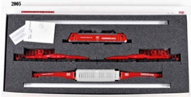
2005 – Märklin Br 185 + 1 vagão c/ transformador (vermelha) – 555 unidades (36835)