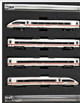
2019 – Piko Br 412/ICE 4 (branco) – 444 unidades (Piko 51403)