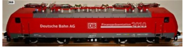
2010 – Märklin Br 189 (vermelha) – 555 unidades (39890)