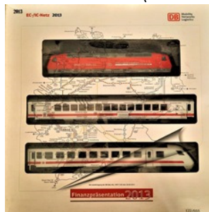
2013 – Märklin Br 120 + 2 carruagens (vermelha) – 555 unidades (37543)