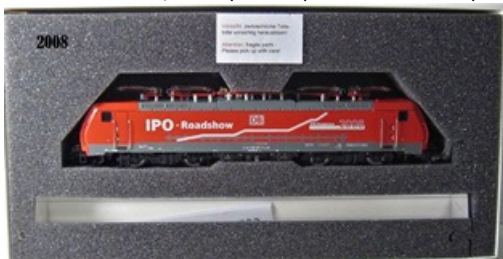
2008 – Märklin Br 189 (vermelha) – 555 unidades (39890)