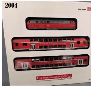
2004 – Märklin V218 + 2 carruagens – 555 unidades (33745)