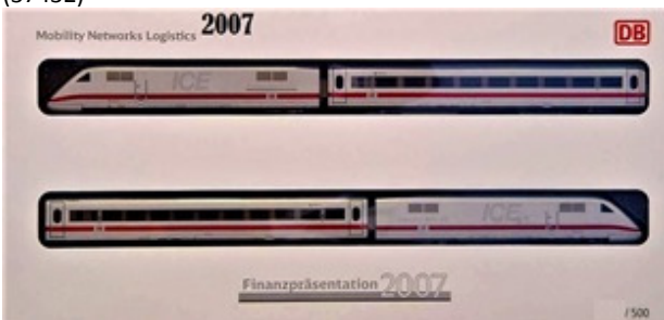
2007 – Märklin Br 401/ICE 1 (branco) – 500 unidades (39712)