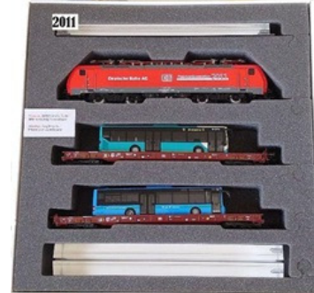
2011 – Märklin Br 189 + 2 vagões c/ camião (vermelha) – 555 unidades (39896)