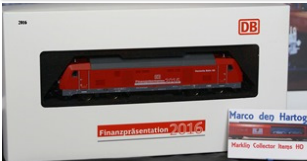
2016 – Märklin Br 245 (vermelha) – 400 unidades (36645)