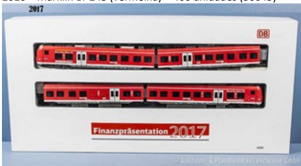
2017 – Piko – Br 440 (vermelha) - 555 unidades (Piko 59990)