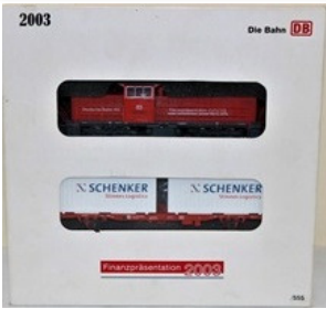
2003 – Märklin Br 6400 + 1 vagão (vermelha) – 555 unidades (26515)