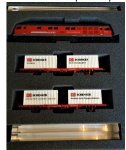
2014 – Märklin Br 230 + 2 vagões (vermelha) – 555 unidades (26599)