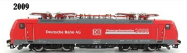
2009 – Märklin Br 189 (vermelha) – 555 unidades (39890)