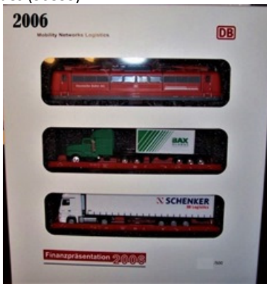
2006 – Märklin Br151+2 vagões c/camião – 500 unidades (37432)