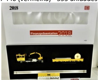
2018 – Märklin DB Robel (amarelo) – 400 unidades (36000.002)