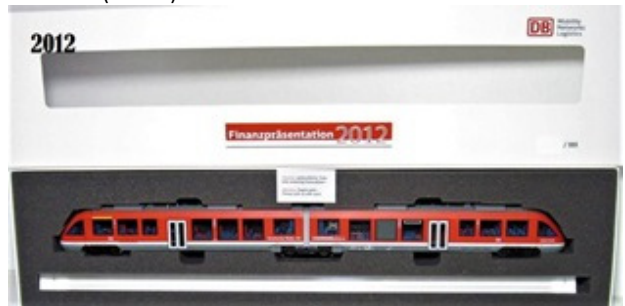
2012 – Märklin Br 648 (vermelha) – 555 unidades (37737)