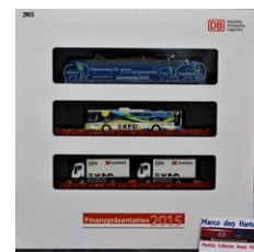
2015 – Märklin Br 185 + 2 vagões c/camião (azul) – 555 unidades (36830)