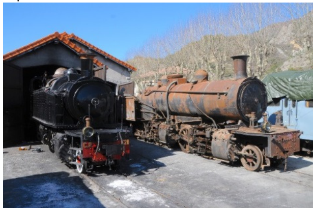
As Mallet portuguesas E211 e E182 no depósito do GECP de Puget-Théniers, em 14 de Março 2020.

A E182 foi comprada em 1985 por um apaixonado espanhol e ficou estacionada durante 35 anos na