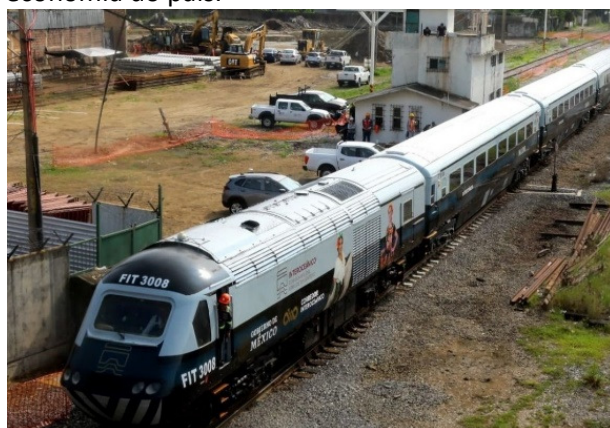
Imagem Rail UK Forum, HST México

Felizmente, já no México, a previsão é a sua utilização no “Ferrocarril del Istmo de Tehuantepec”, para já na recém reaberta Linha Z, cuja inauguração do serviço de passageiros ocorreu no passado dia 22 de dezembro. Esta linha, compreendida entre Coatzacoalcos e Salina Cruz, faz parte do projeto “Tren Interoceánico”, iniciado pelo governo mexicano, que visa renovar e modernizar um conjunto de três linhas, atualmente apenas para transporte de mercadorias, na perspectiva de criar uma rede ferroviária moderna que ligue os oceanos Atlântico e Pacífico, dinamizando, assim, o território e desenvolvendo a economia do país.