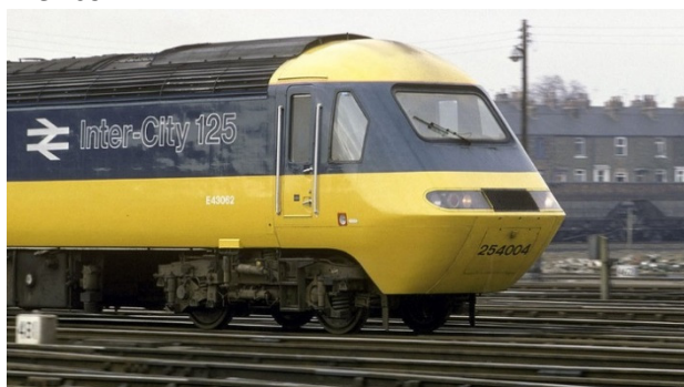
Imagem BBC, UK 80s

Foi com enorme surpresa que os entusiastas e admiradores destes nobres comboios receberam a notícia de um carregamento de unidades da série “Class 43” – os famosos HST, e respetivas carruagens Mark-3, num navio destinado ao México.